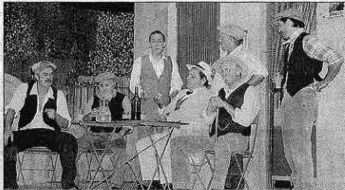
► L'époustouflante interprétation des acteurs a valu de longues ovations.

Dès les premières paroles, l'assistance était sous le charme. Une interprétation émouvante jusqu'aux larmes, notamment grâce aux